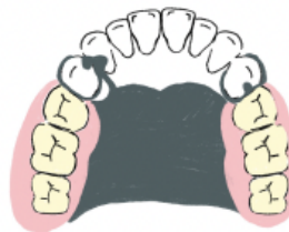
バラタルプレート