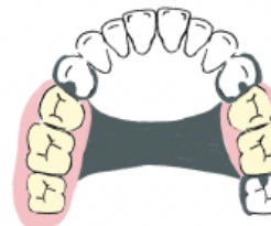
バラタルストラップ