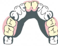
馬蹄形バー(ホースシューバー)