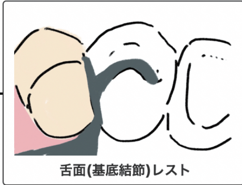
舌面(基底結節)レスト